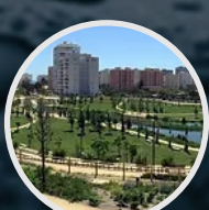
Proyectos de Loteo y Urbanización