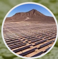
DECLARACIONES DE IMPACTO AMBIENTAL