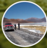
VIGILANCIA Y SEGUIMIENTO AMBIENTAL