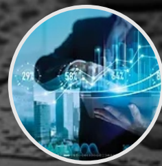
ANÁLISIS Y MEJORAMIENTO DE GESTIÓN