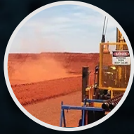
Mecánica de Suelos