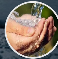
Reúso de Agua