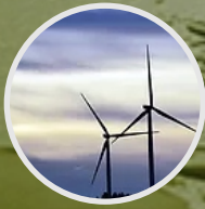
ANÁLISIS DE PERTINENCIA AMBIENTAL