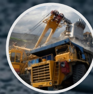
Ingeniería para la Minería