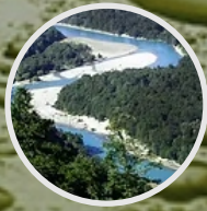
LÍNEA BASE DE HIDROLOGÍA E HIDROGEOLOGÍA