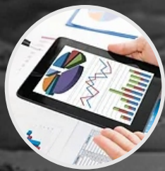
PLANES DE EMPRESAS REGULADAS Y NO REGULADAS

El Área de Estudios de Ingemab es su motor de inteligencia y estrategia. Nos especializamos en transformar la complejidad regulatoria, económica y operativa en soluciones rentables y claras.