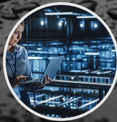
AUDITORÍAS A SISTEMAS DE INFORMACIÓN Y OPERACIONES