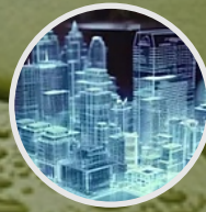
DISEÑO ARQUITECTÓNICO SUSTENTABLE Y RETROFIT DE EDIFICIOS